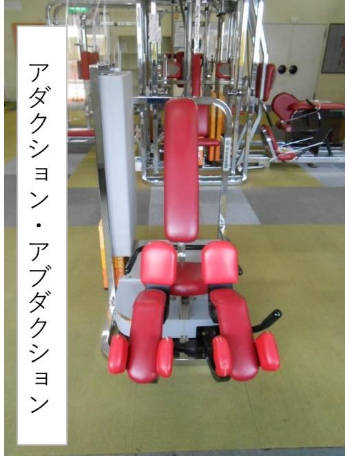
アダクション・アブダクション