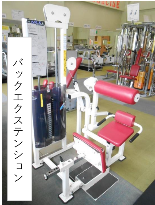
バックエクステンション