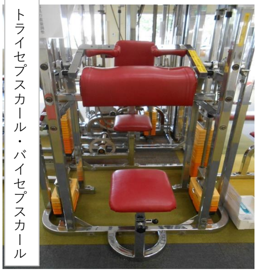
トライセプスカール・バイセプスカール