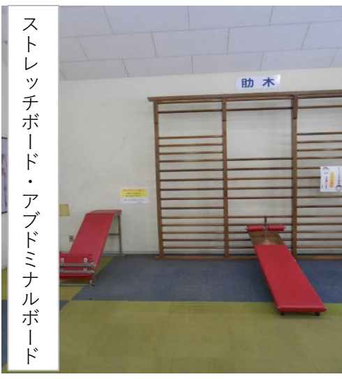
ストレッチボード・アブドミナルボード