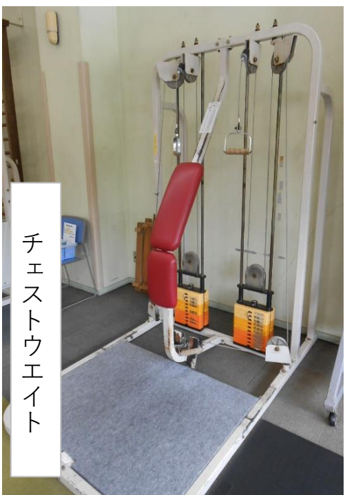
チェストウエイト