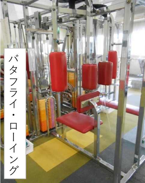
バタフライ・ローイング