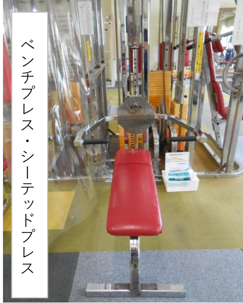
ベンチプレス・シーテッドプレス